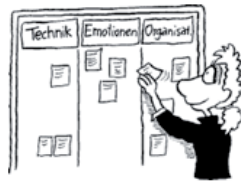
2. In der Rolle als Moderatorin