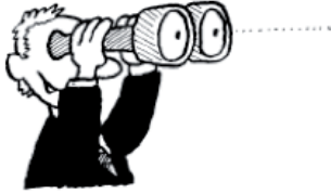
1. In der Rolle als Wächterin