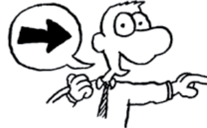
3. In der Rolle als Promotorin